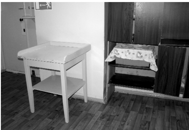
■ Так было.

На прошлой неделе в Иркутской области официально отменили карантин по гриппу и ОРВИ. Теперь больных, которые проходят лечение в стационарах, разрешено навещать родственникам. Этому особенно рады мамы детей первого года жизни, ведь в их отделении в марте открыли уютный уголок для встреч с близкими.