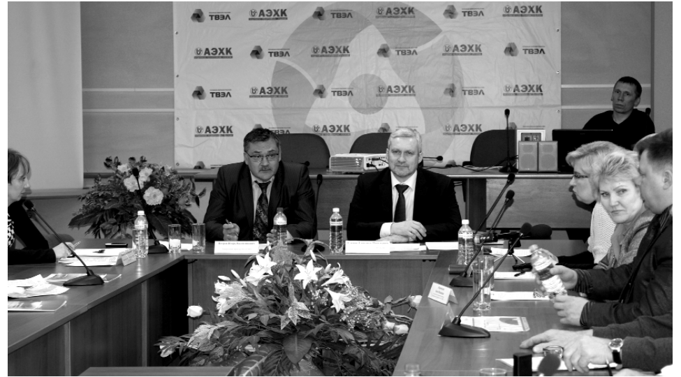
■ 21 марта прошли общественные слушания по раскрытию приоритетных тем годового отчета АО «АЭХК» за 2015 год.